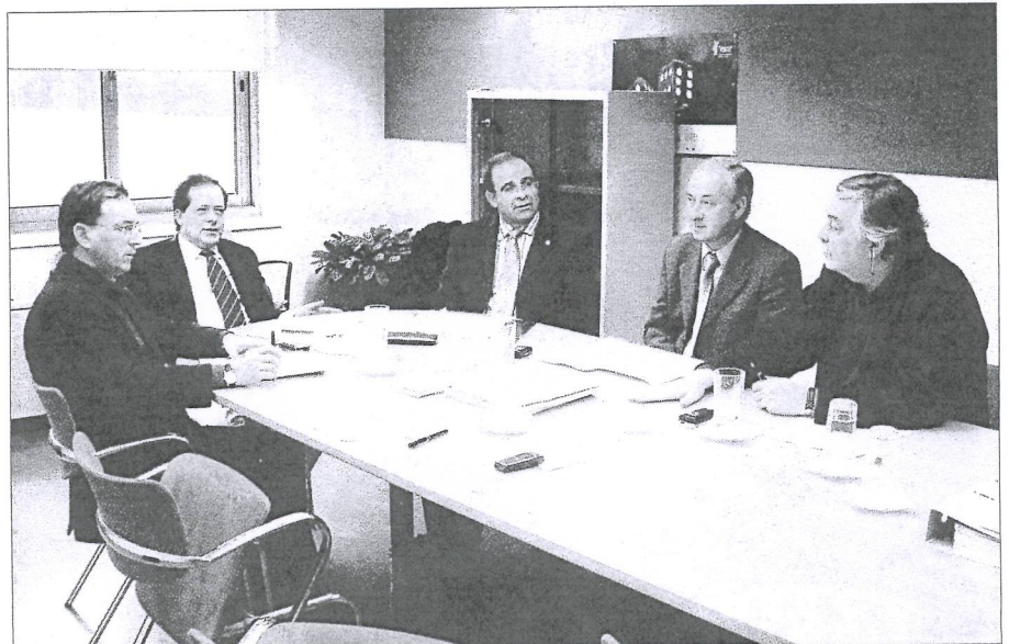
Conselho Directivo aprovou Agenda 21 do Vale do Minho

O Conselho Directivo da Comunidade Intermunicipal do Vale do Minho anunciou a apresentação de quatro candidaturas ao Programa Operacional Regional do Norte (ON.2) 2007-2013 no valor de cerca de seis milhões de euros.